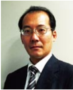
日経BP コンピュータ・ネットワーク局 ネット事業プロデューサー 兼 日経コンピュータ 編集プロデューサー