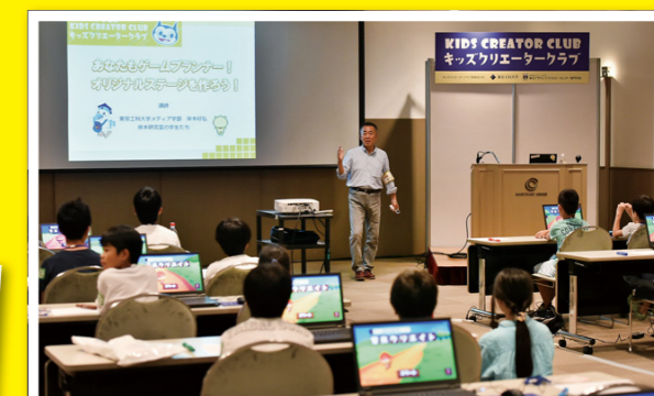
写真は2016年に実施したキッズクリエイタークラブの教室風景です。