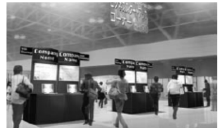
《コーナーイメージ図》