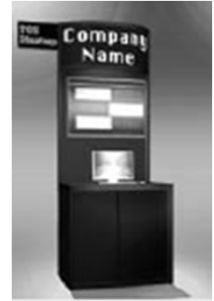
《ターンキーブースイメージ図》

※2011年1月以降設立のベンチャー企業が対象となります。 ※1社につき最大3小間までのお申し込みとさせていただきます。 ※ターンキーブースは、出展料金にコーナー専用の基礎装飾（展示台、照明、電源など）が含まれます。 基礎パネル・展示台は黒になります。基礎装飾の詳細は、「パッケージブースのご案内」を参照ください。 ※PC/A1パネルは含まれません。 ※申込時に会社案内など所定の書類をご提出いただけます。