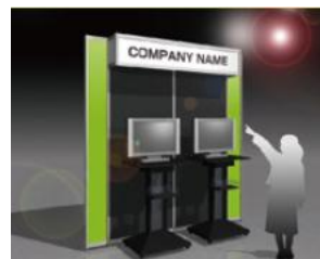
ゲーム機の設置例