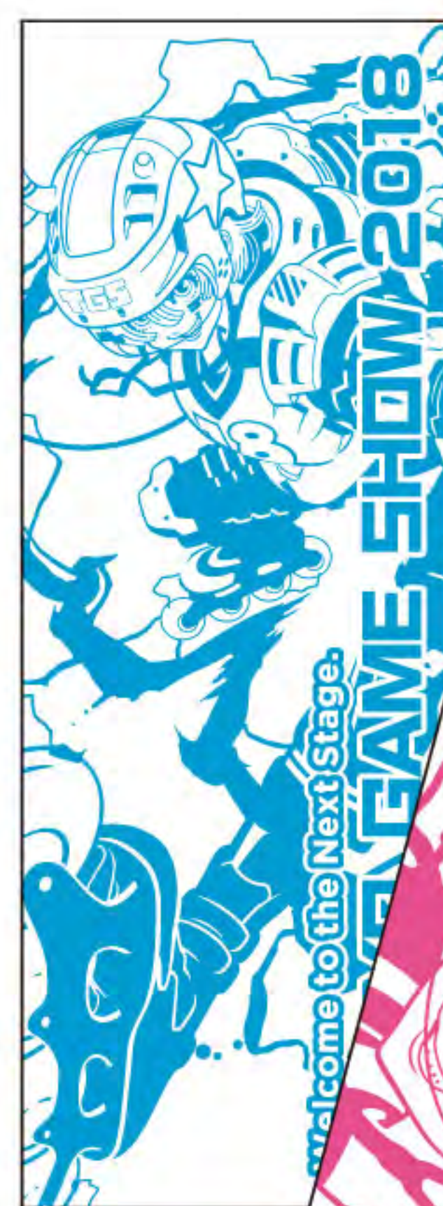
◀ スポーツタオルC 2,300円