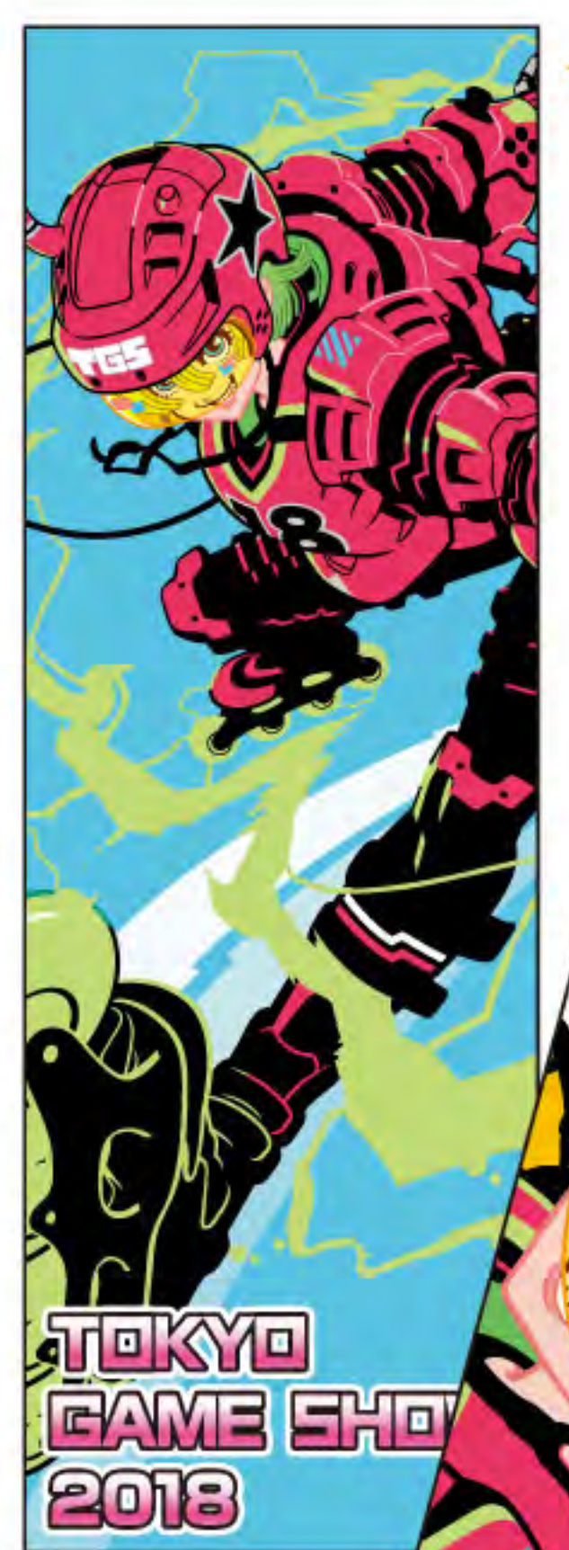
◀ スポーツタオルA 2,800円