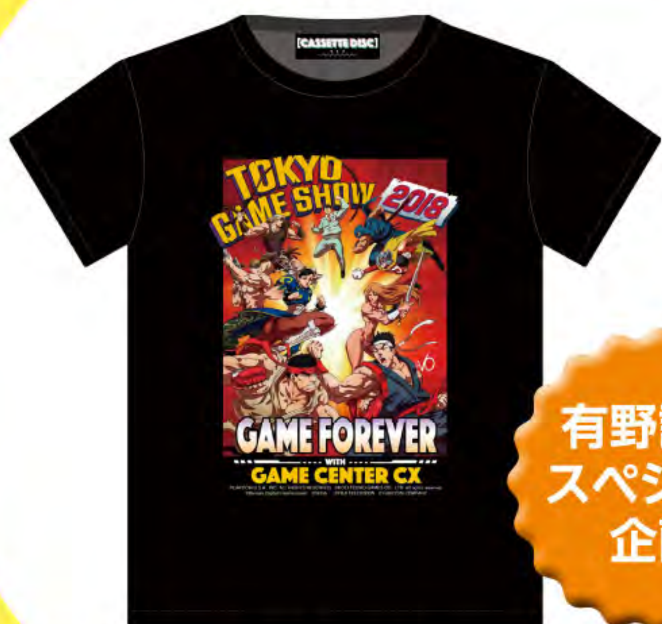
▲ TシャツM 4,000円