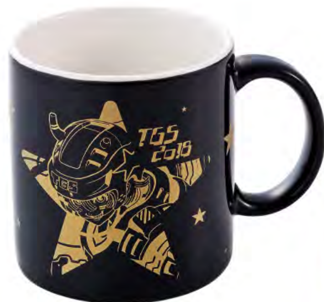
▲ マグカップ 1,300円