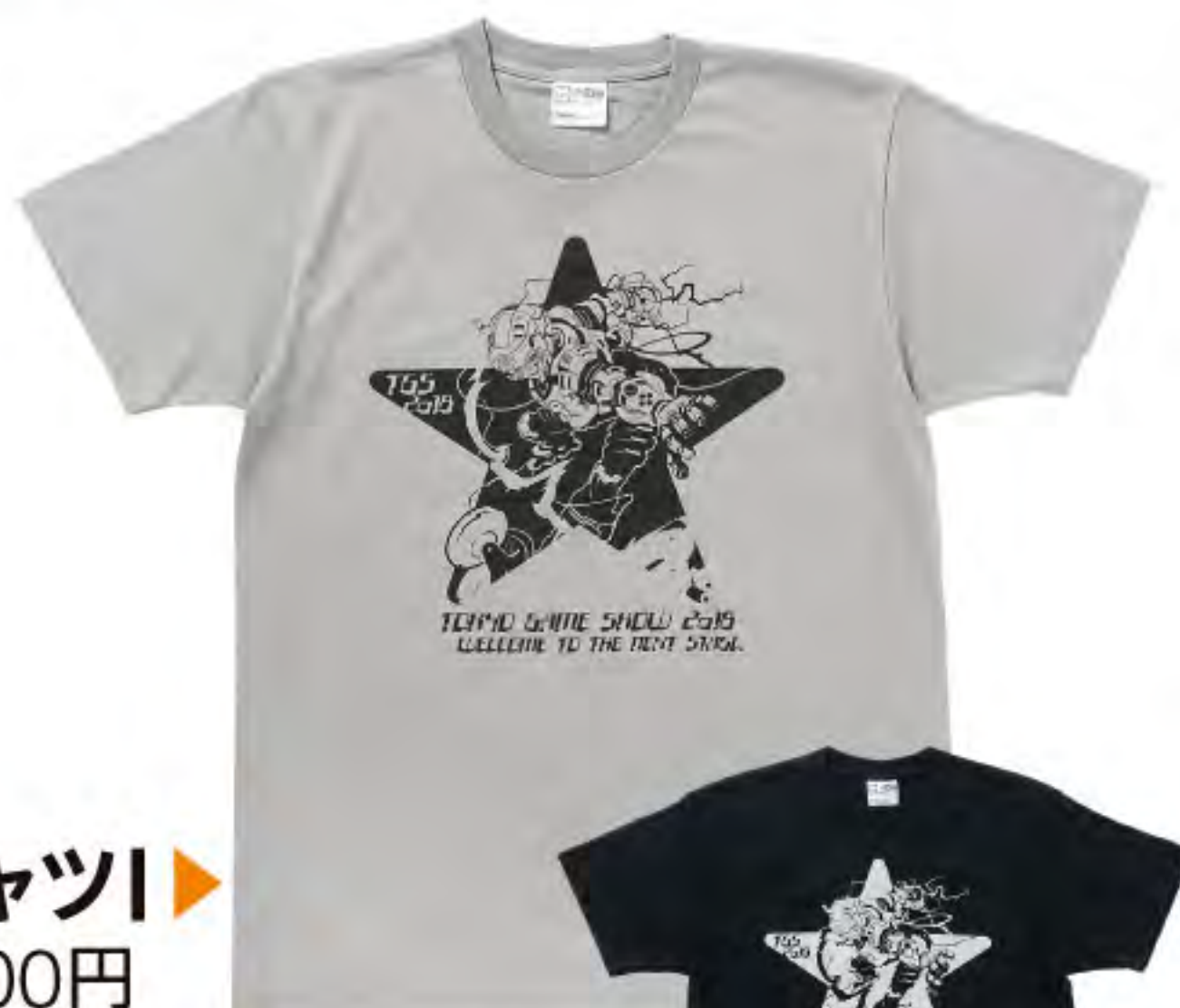
TシャツI ▶ 2,800円