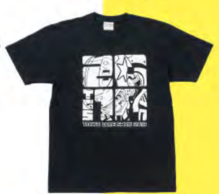
▲ TシャツG 2,800円