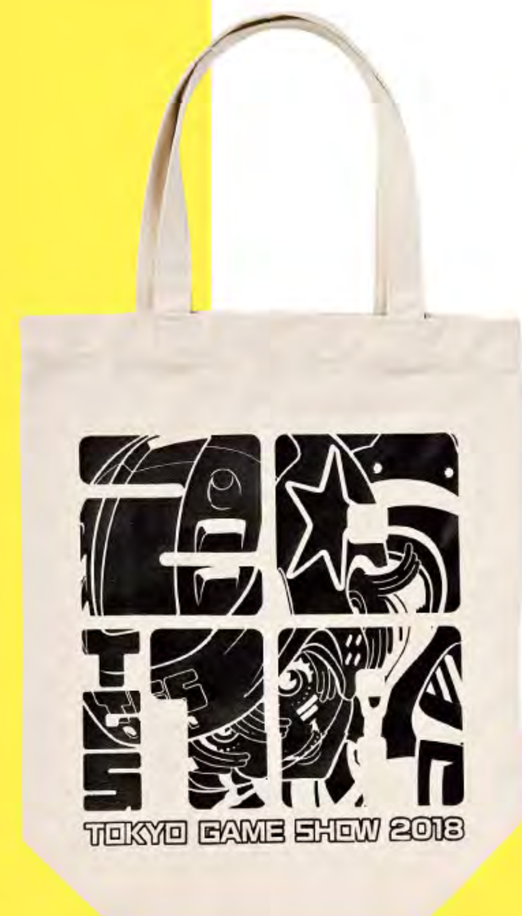
◀ トートバッグ 1,500円