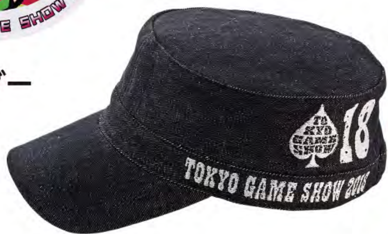
◀ キャップ 2,500円