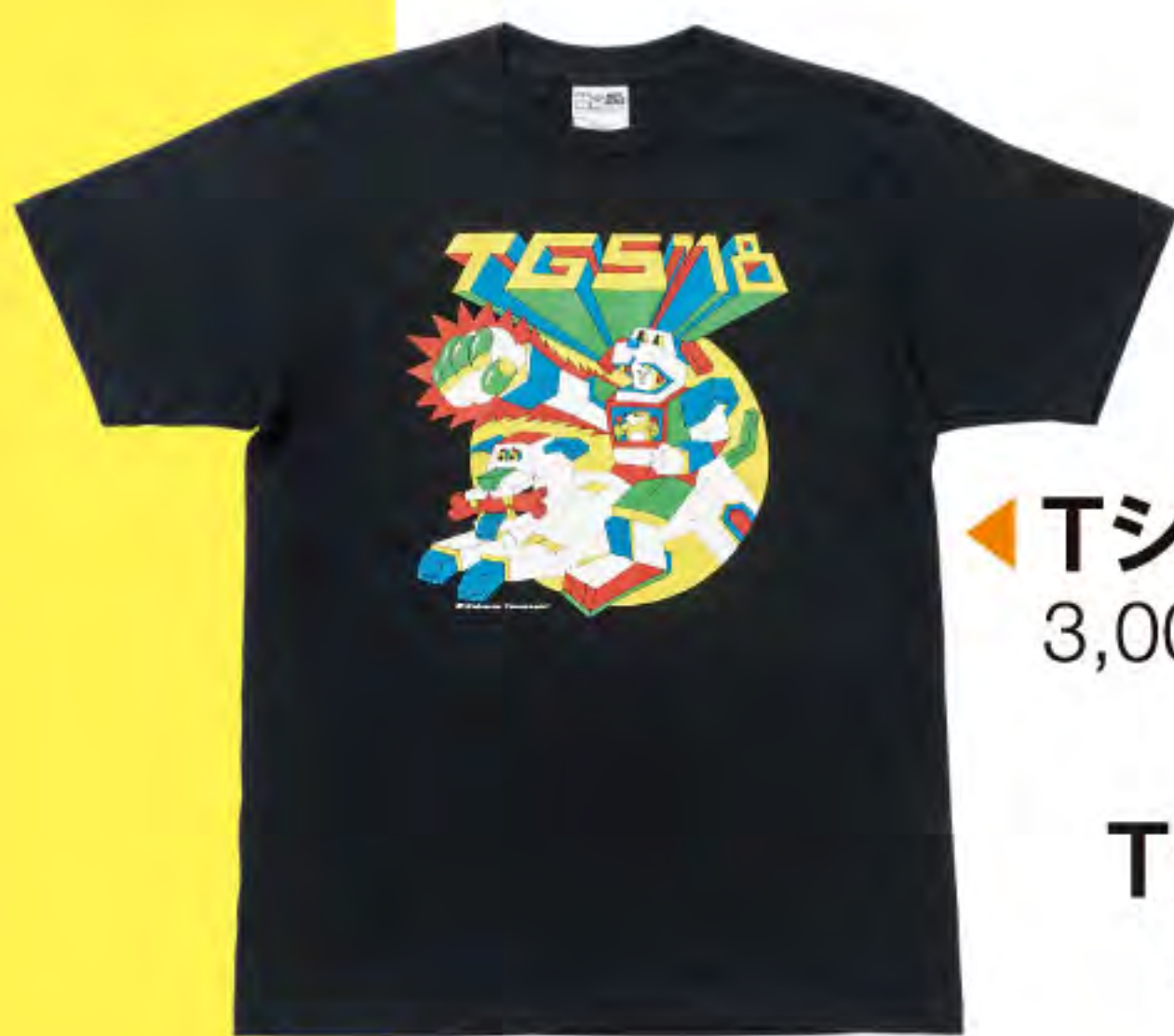
◀ TシャツK 3,000円