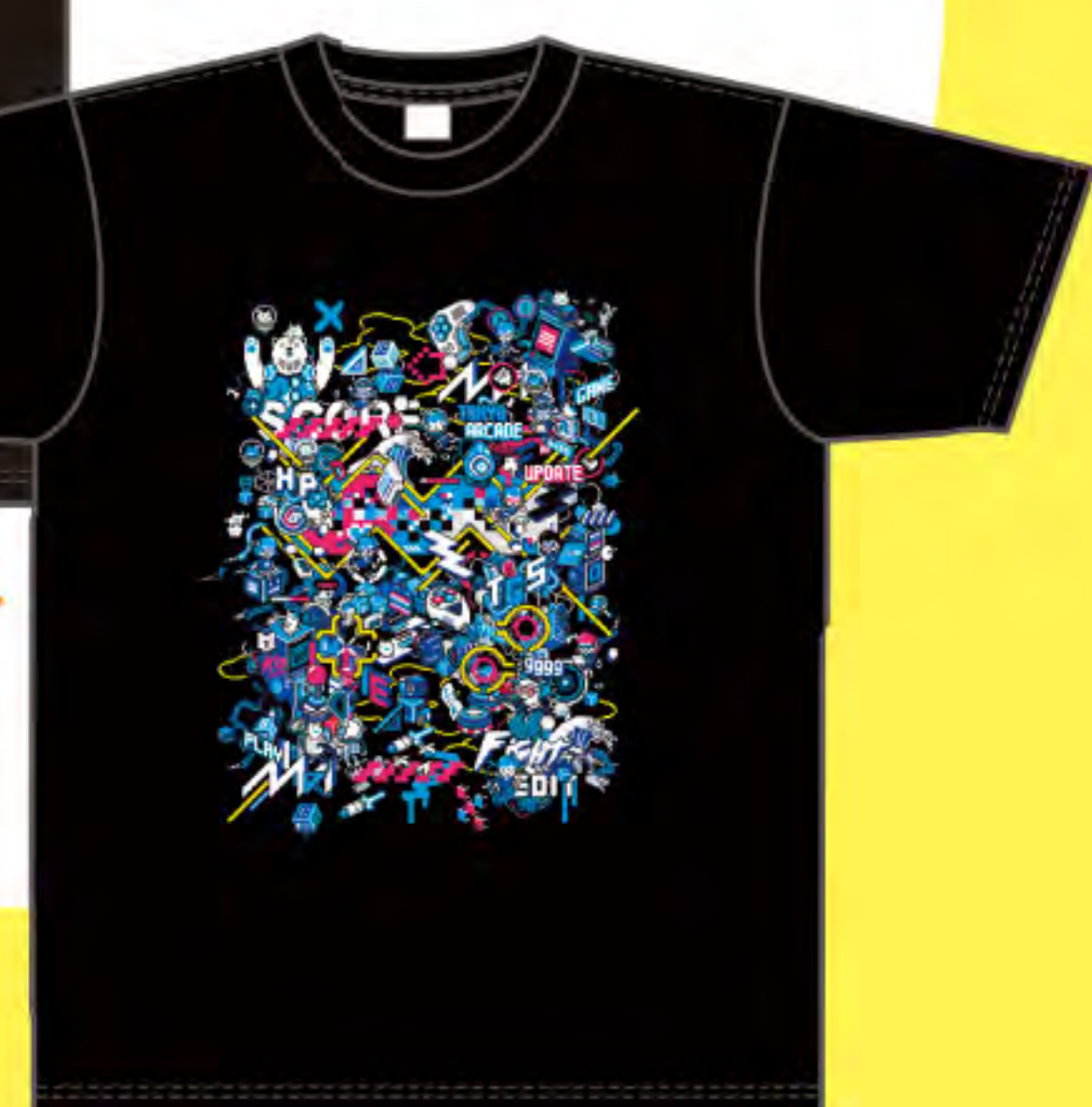
TシャツN ▶ (BAN-8KU) 3,500円

「ゲームセンターCX」、 「Tokyo Otaku Mode」との コラボTシャツをご用意!