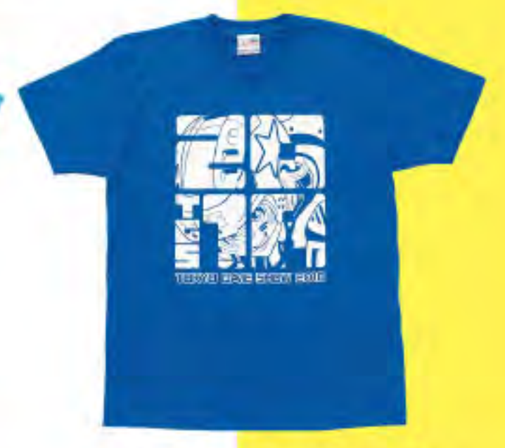
▲ TシャツD 2,800円