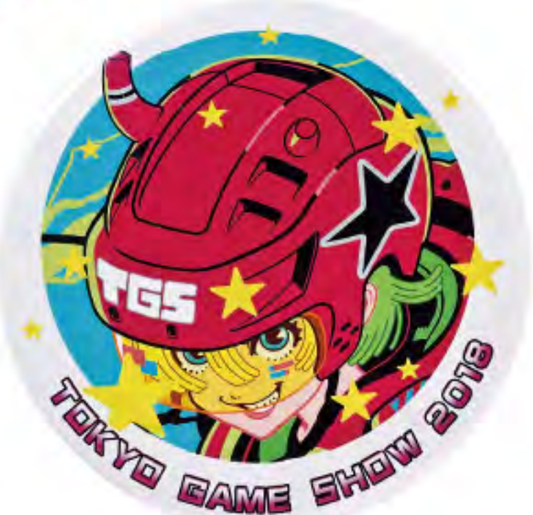
缶バッジ ▶ 500円