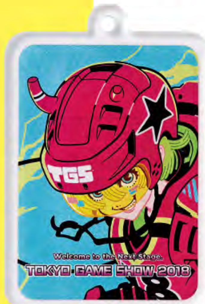
◀ キーホルダー 800円