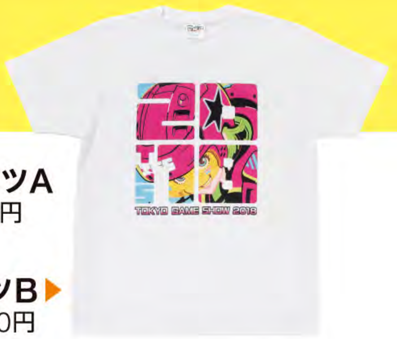
TシャツB ▶ 3,000円