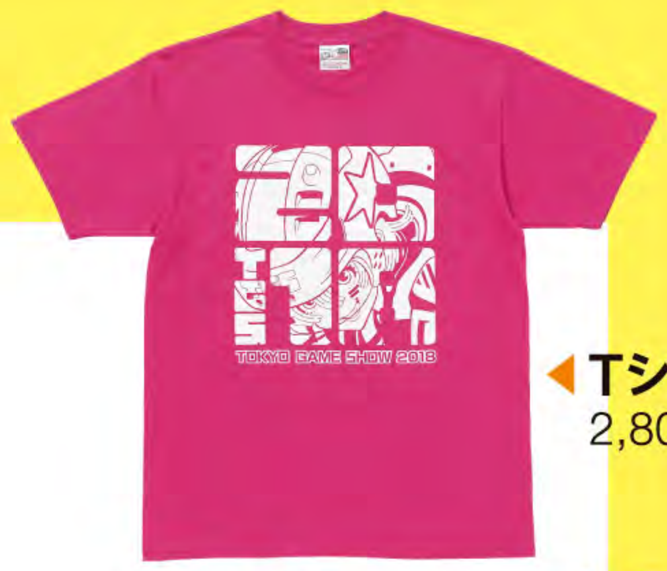
◀ TシャツC 2,800円