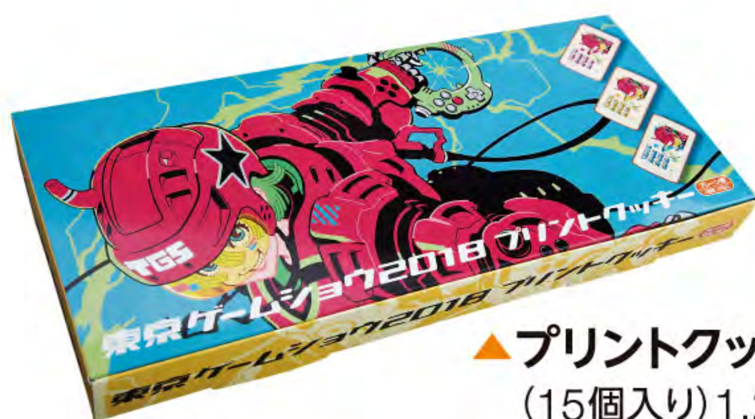
▲ プリントクッキー (15個入り) 1,200円