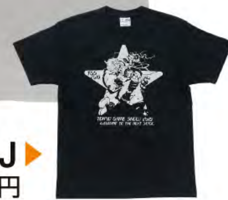
TシャツJ ▶ 2,800円