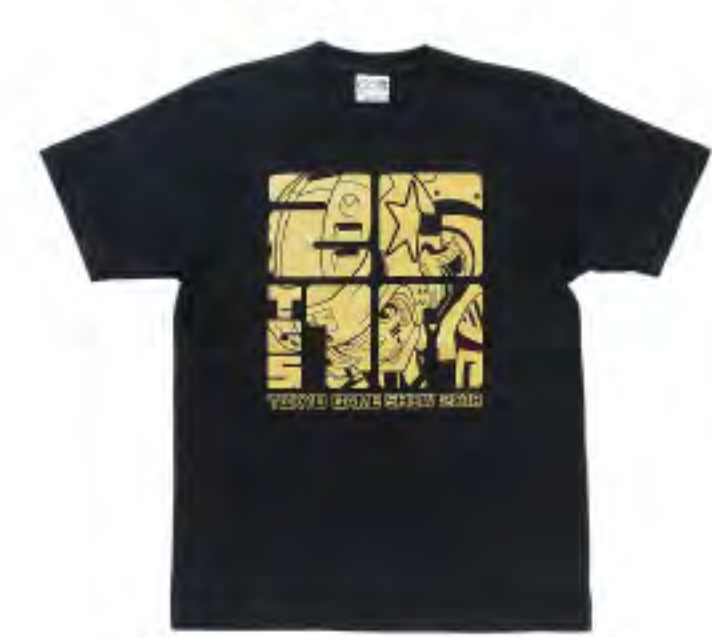
▲ TシャツF 2,800円