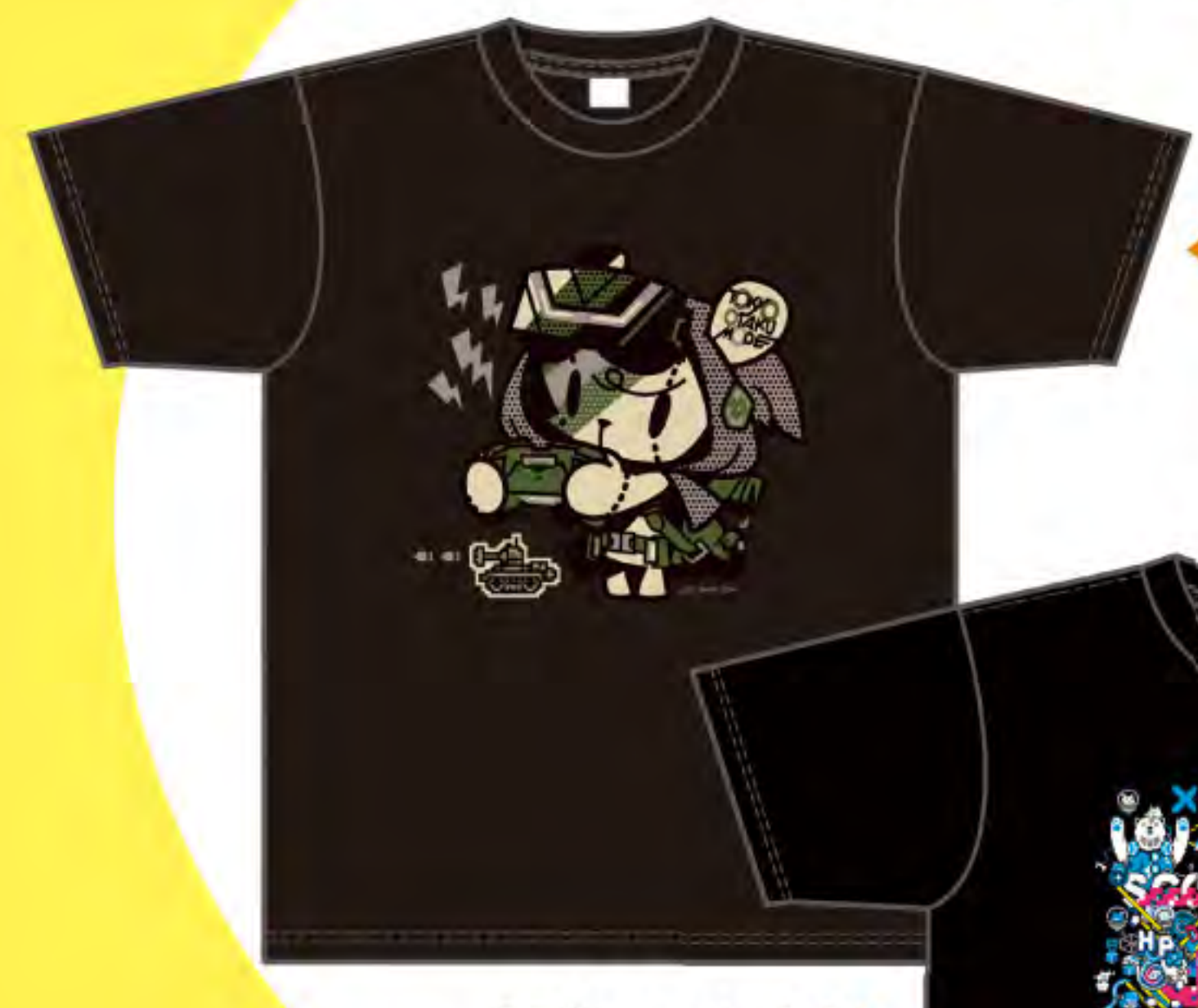
◀ TシャツO (上田バロン) 3,500円