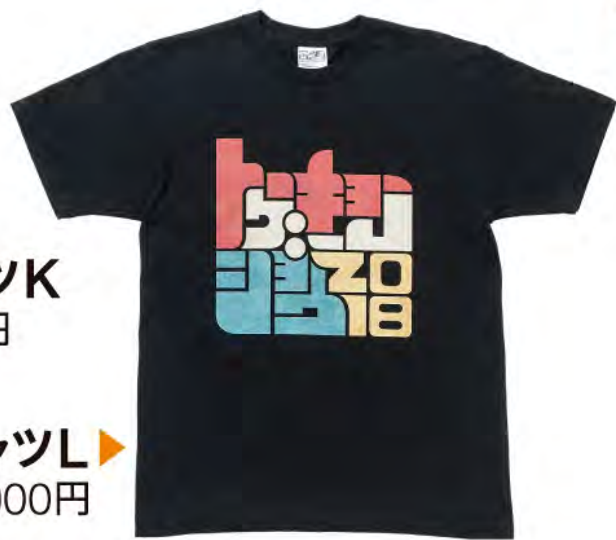
TシャツL ▶ 3,000円