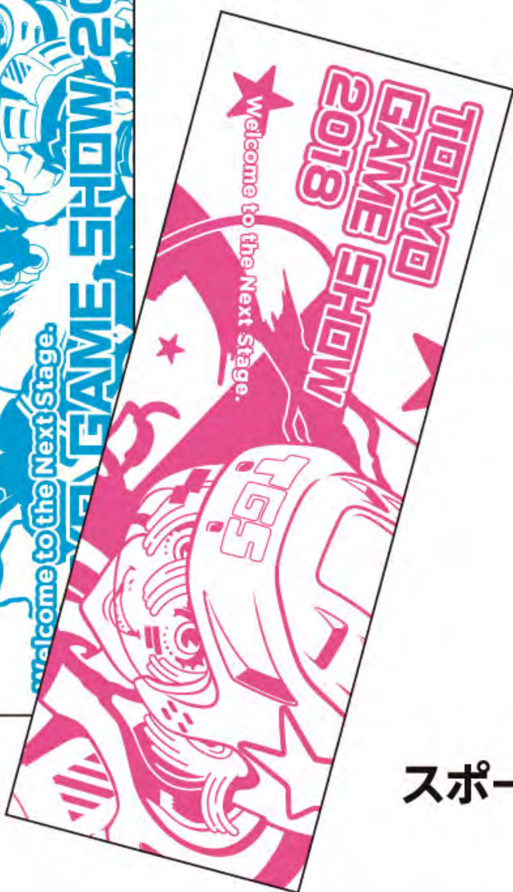
スポーツタオルB ▶ 2,800円