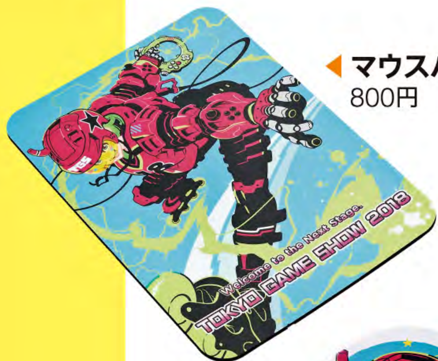
◀ マウスパッド 800円