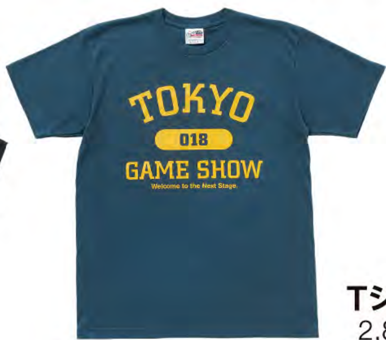
▲ TシャツH 2,800円