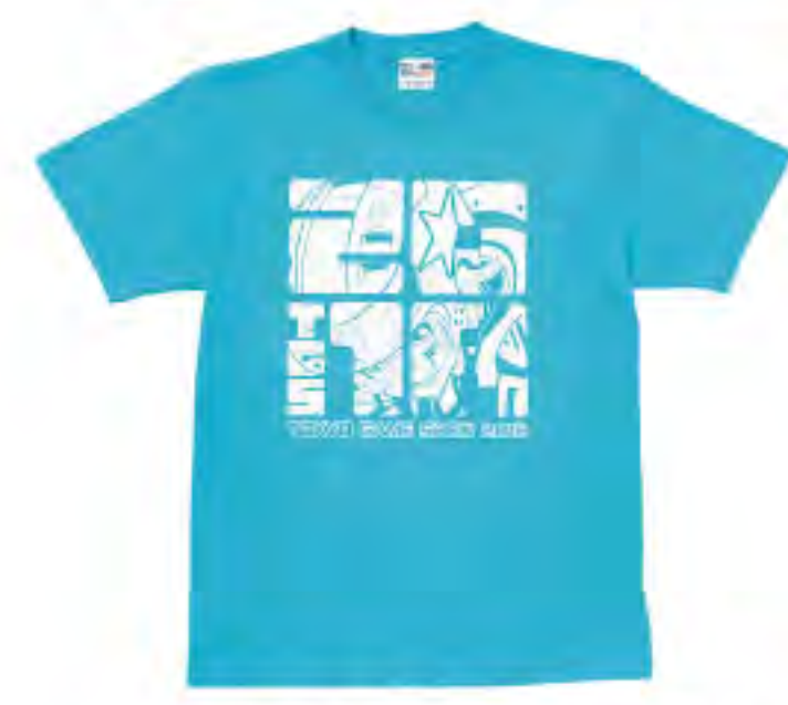
▲ TシャツE 2,800円