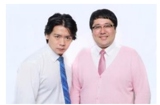
マチカルラブリー